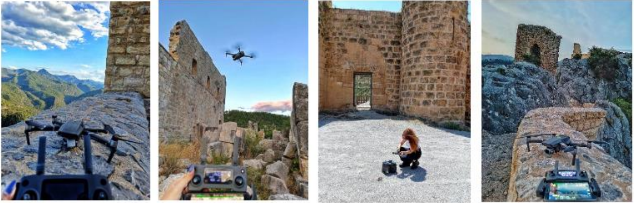
Şekil 3. Saha çalışmalarına ait görüntüler verilmiştir.

Veri toplama sürecinde, uçuş görevi olarak cihaz içerisine yüklenen tarihi yapı alanları içerisinde eğimli haritalama yöntemi ile uçuş gerçekleştirilmiştir. Burada aynı alan içerisinde farklı rotalardan farklı açılarda uçuş görevleri gerçekleştirilmiştir.