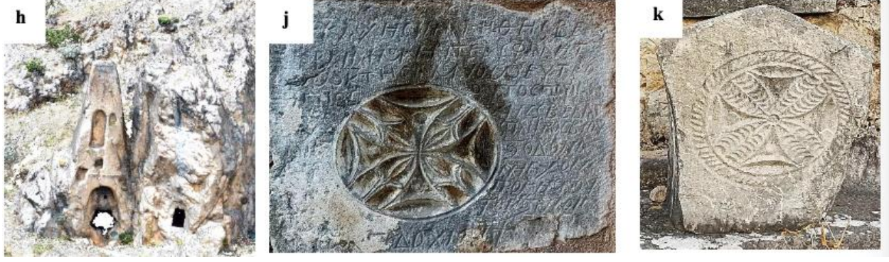
Şekil 5. Tarihi yapılarda dikkat çeken şekilsel unsurlar verilmiştir. h) kaya mezarı j,k) kara kilise