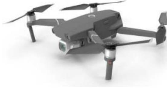
Şekil 2. Çalışmada kullanılan İnsansız Hava Aracı (İHA) DJI Mavic 2 Pro

Çizelge 1. İnsansız hava aracına ait bazı özellik ve çalışma sırasında kullanılan bazı değerler verilmiştir.