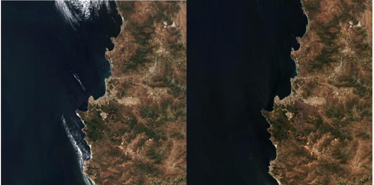
Şekil 2. Yangın öncesi ve sonrası için kullanılan Sentinel L2A RGB uydu görüntüleri (Copernicus, 2024). a) 18 Ocak 2024 Şili Valparaíso RGB uydu görüntüsü b) 11 Şubat 2024 Şili Valparaíso RGB uydu görüntüsü

Çalışmada, yangın analizi için Şili Valparaíso bölgesine ait yangın öncesi ve sonrası için Copernicus Sentinel-2 Collection 1 MSI Level-2A (L2A) uydu görüntüleri kullanılmıştır. Görüntüler açık kaynaklı olup, herhangi bir düzeltme gerektirmeden direkt olarak kullanıma hazır şekilde elde edilmiştir. Yangın öncesi için 18 Ocak 2024 tarihli ve yangın sonrası için 11 Şubat 2024 tarihli uydu görüntüleri kullanılarak analiz gerçekleştirilmiştir.