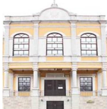
Şekil 2. Fotoğrafların Photoshop ile Temizlenmesi