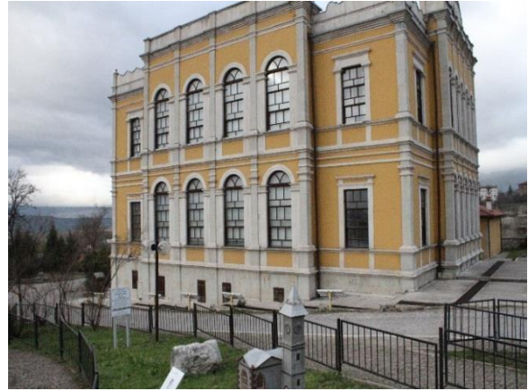
Şekil 1. Bina Cephe Fotoğraflarının Çekimi