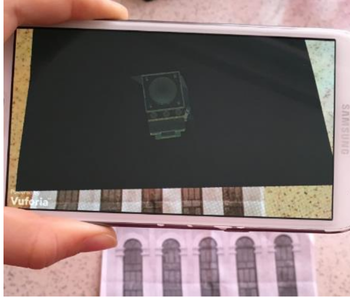
Şekil 5. Mobil Uygulama Geliştirme

Geliştirilen uygulamanın kullanıcılara sunulabilmesi için Android teknolojisi kullanılacaktır. Geliştirilen Android tabanlı arayüz ile kullanıcılar belirlenen ilgi noktaları ile ilgili bilgilere kolaylıkla ulaşabileceklerdir. Mobil cihazın ilgi noktalarını tanıması ile bu noktalar ile ilgili veritabanında bulunan veriler kullanıcılara sunulacaktır. Kullanıcılar ilgi noktaları ile ilgili 3B modellere, tarihsel fotoğraflara, kültürel müzik, hatta sanatsal animasyon metinlerine kolaylıkla erişebileceklerdir.