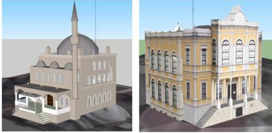
Şekil 3. 3B Modelleme

yapılar kullanılacak fakat bina içi uygulamalar gibi özellikler kullanılmayacağından dolayı bina modelleri LoD2 ve LoD3 detay seviyesinde oluşturulmuştur.